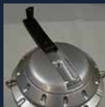
手動式充電ハンドル